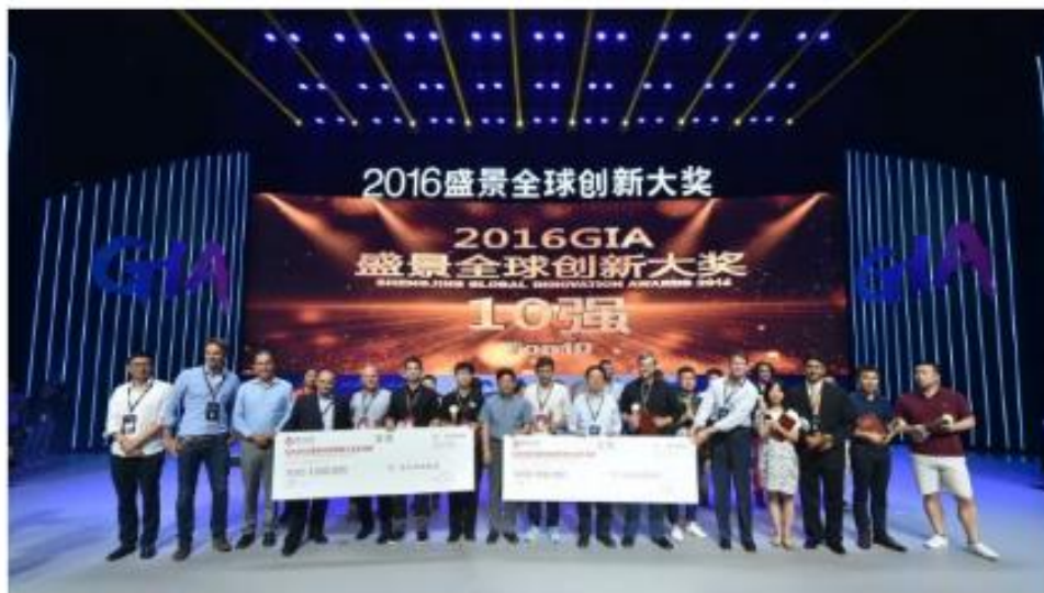
2016年8月9日，盛景全球创新大奖赛全球十强合影。

第二届GIA2016盛景全球创新大奖全球总决赛于8月9日在北京举行，大赛选出了全球十大创新企业，其中以色列语言障碍纠正应用NiNi Speech和无人机自动导航系统Aerial Guard斩获冠军和亚军的宝座。第一届比赛的冠军也是由以色列企业获得。