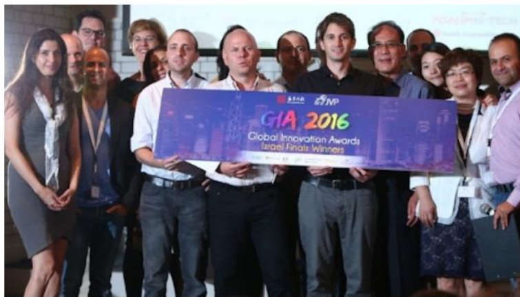
GIA 2016 finalists and partners

Two Israeli firms — NiNiSpeech and AerialGuard — were winners of the Global Innovation Awards 2016 in China this week