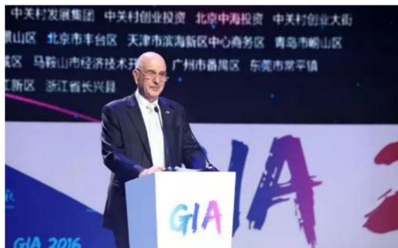
2016年8月9日，以色列驻华大使马腾出席盛景全球创新大奖赛。

今年的盛景全球创新大奖，分为中国、美国、以色列、欧洲四大赛区，吸引了全球超过3500家创新创业企业参赛，胜出的20强选手入围全球总决赛，他们分别来自AR/VR、智能制造、文化娱乐、企业级服务、互联网+、大数据&AI、生物和数字医疗、机器学习等新经济领域。