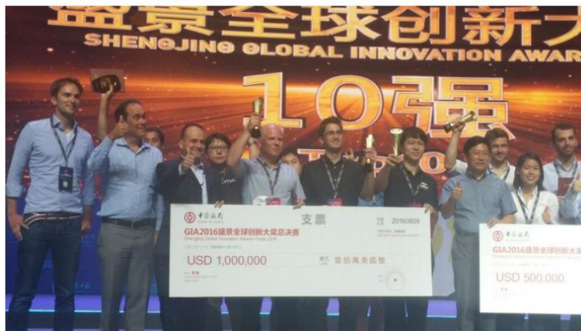
Israeli startups NiniSpeech and AerialGuard hold up prize checks for their first and second place finishes at the Global Innovation Awards 2016.

Israeli startups take first and second place in the final round of Chinese-led $1.5 million tech competition.